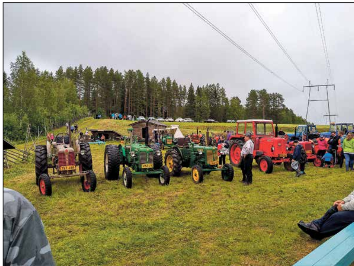
Karppalan myllypäivä keräsi satapäisen ihmisjoukkion ja mittavan museokalunäyttelyn.