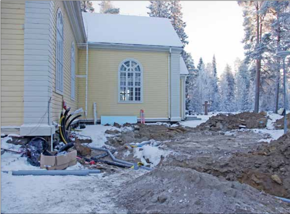
Kaunis kirkkomme oli talviaikaan remontin vuoksi pois käytöstä. Pihakin oli varsin myllätyn näköinen. Nyt maalämpöjärjestelmä on toiminnassa kirkko käytössä. Pihatyöt ovat vielä kesken. Seurakunta tiedottaa kirkon tilanteesta enemmän seuraavassa numerossa.