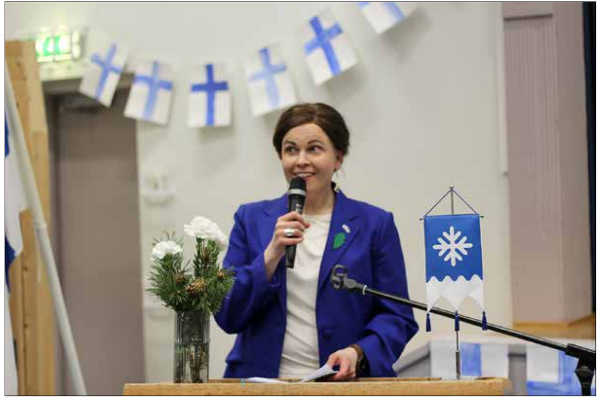
Tiede- ja kulttuuriministeri Mari-Leena Talvitie toi juhlaan valtiovarainministerin tervehdyksen.

ven koulutoimen pitkä historia ja ajatus: ”pienikin on tärkeä”. Koulun toimintaa halutaan pitää edelleen yllä ja kehittää, mikä onkin sivistyksen ja elämän kannalta hyvin merkittävä asia.