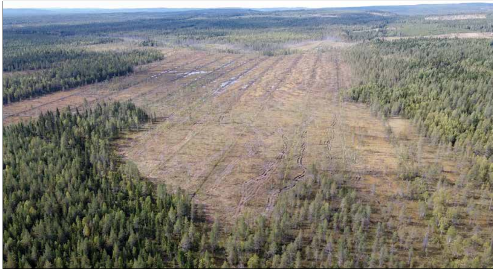
Liejusuon ennallistamishanke on lähes valmis. Viimeistelytyöiden tarve arvioidaan vielä kesän alussa.