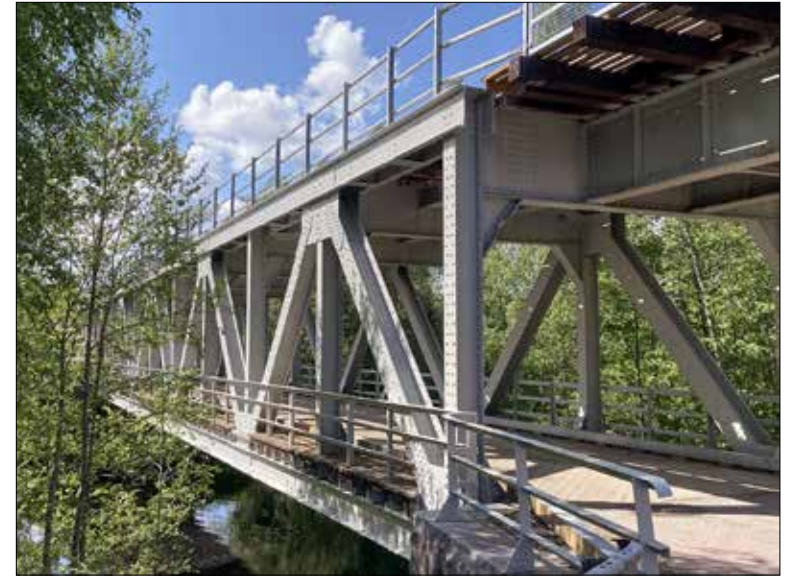
Kirnukosken sillalla tanssitaan heinäkuun illassa.