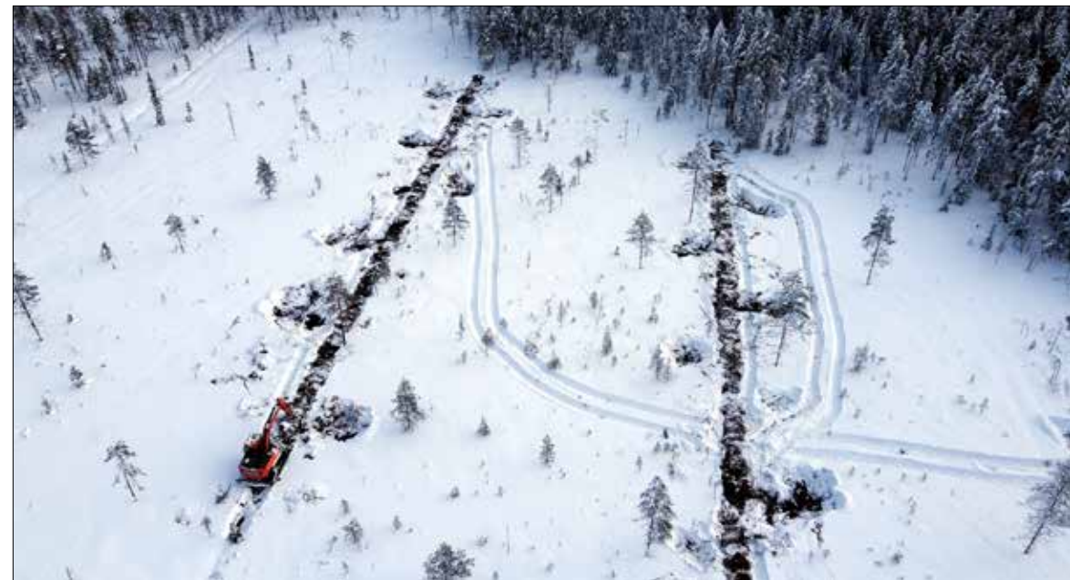
Tällä kertaa ei kaivetakaan oja, vaan peitetään.