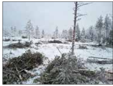
Liejusuo hakkuun jälkeen.

Taajama-alueella tullaan tekemään harvennuksia paloaseman ympäristössä ja Virtaalan lähistöllä. Vanhan koulun ympäristössä harvennusten pääpaino on vanhojen vikaisten puiden poisto ja alueella kasvavan nuoren puuston kasvuedellytysten parantaminen. Kunta on laatimassa hakkuille maisematyölupaa. Hakkuiden toteutus voi olla jo tämä keväänä viime lumil-