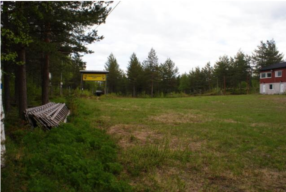
Asuntovaunualan huoltorakennus ja hiihtostadion, johon suunnittelualue rajautuu etelässä.