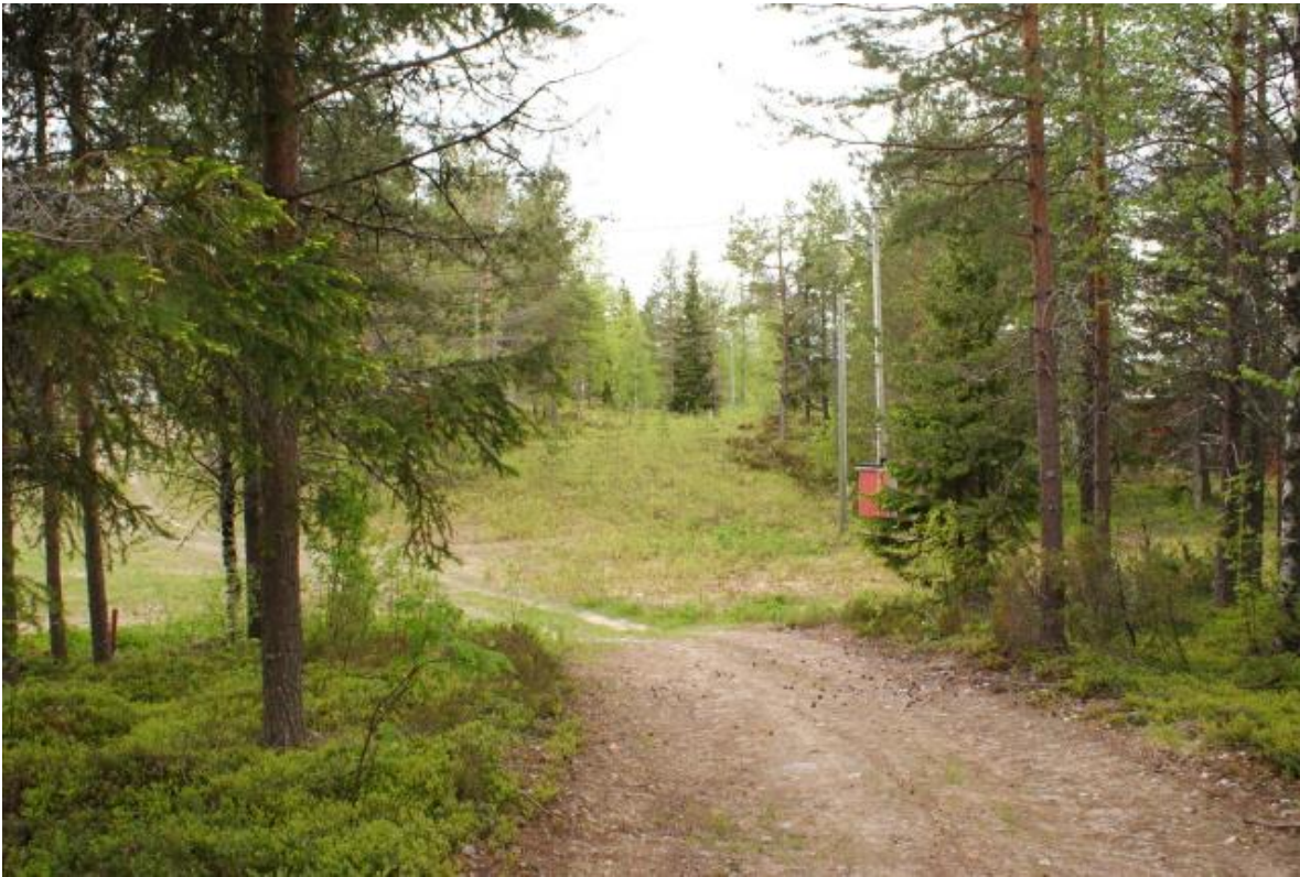
Näkymä suunnittelualueen eteläosasta sisääntulotielle päin.