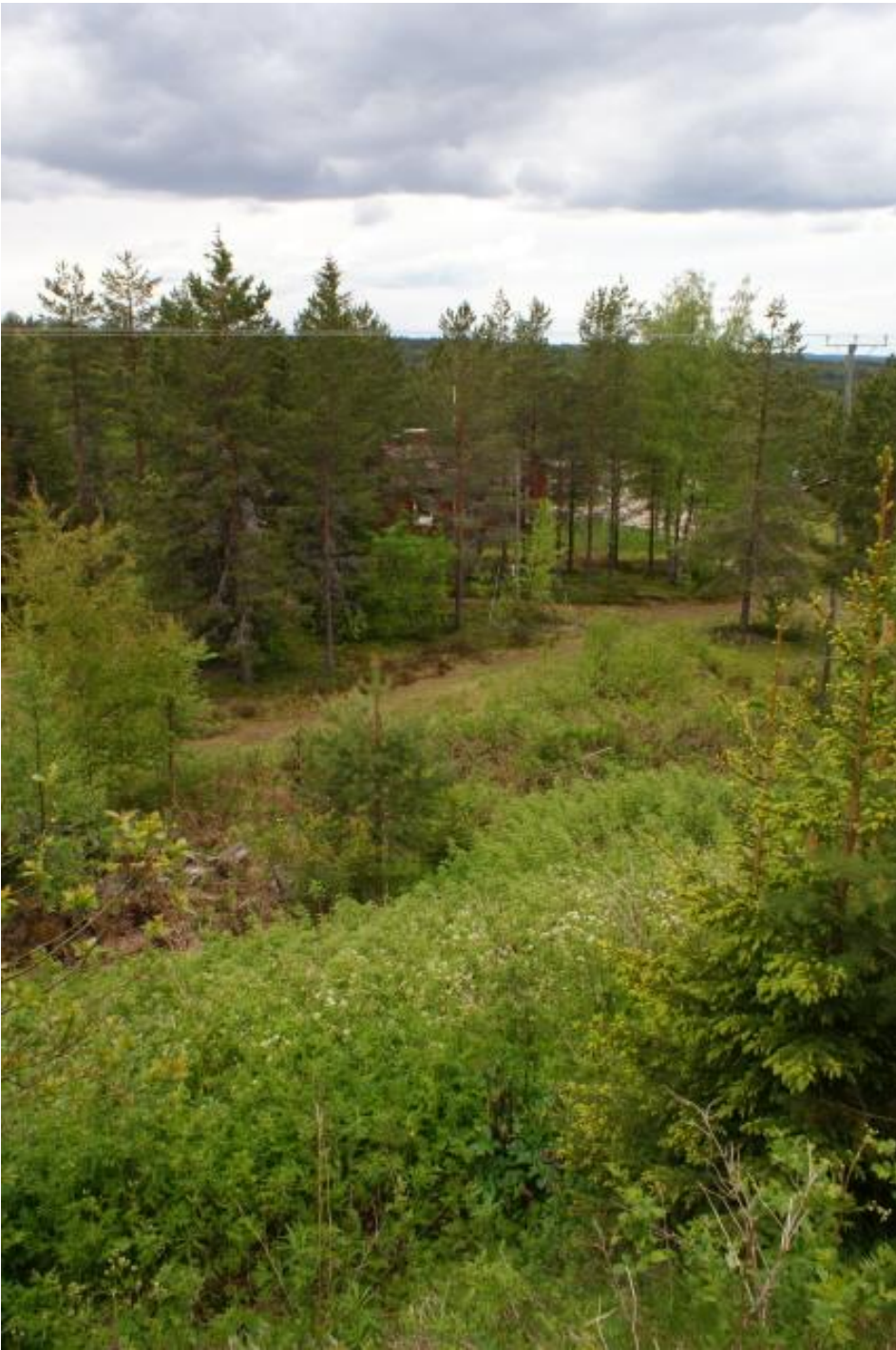
Näkymä suunnittelualueen viereisen hiihtohissin ylätasanteelta hotellille.